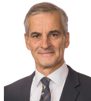
Г-н Юнас Гар Сторе, председатель Рабочей партии Норвегии и руководитель парламентской группы в Стортинг, Норвегия.