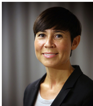
Г-а Ине Марие Эриксен Сёрэйде, (Партия консерваторов), Министр иностранных дел Норвегии.

«Норвежские парламентарии активны в ОБСЕ, и депутат Кари Хенриксен на протяжении многих лет был одним из самых активных норвежских членов Парламентской ассамблеи. Она участвовала во многих миссиях ПА ОБСЕ по наблюдению за выборами, в том числе в Узбекистан, Грузия, Черногория и США. Благодаря своим инициативам по подъему основных принципов ОБСЕ в норвежском парламенте, она повысила престиж ОБСЕ в политических дебатах в Норвегии. Я полностью поддерживаю кандидатуру Кари Хенриксен на пост президента Парламентской ассамблеи ОБСЕ».