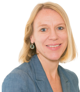
Г-а Анникен Уитфелт, (Рабочая партия Норвегии), пред. Постоянно комитета по внешней политике и обороны в Стортинг Норвегии.

«Норвежские парламентарии активны в ОБСЕ, и депутат Кари Хенриксен на протяжении многих лет был одним из самых активных норвежских членов Парламентской ассамблеи. Она участвовала во многих миссиях ПА ОБСЕ по наблюдению за выборами, в том числе в Узбекистан, Грузия, Черногория и США. Благодаря своим инициативам по подъему основных принципов ОБСЕ в норвежском парламенте, она повысила престиж ОБСЕ в политических дебатах в Норвегии. Я полностью поддерживаю кандидатуру Кари Хенриксен на пост президента Парламентской ассамблеи ОБСЕ».