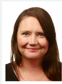
Eva Kristin Hansen, Arbeiderpartiet