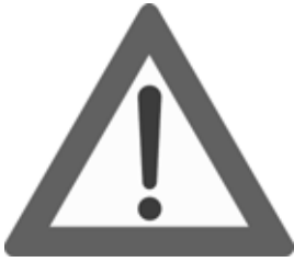
156 Annen fare)

Etter min mening gir dagens skiltsystem tilfredsstillende muligheter til å varsle om fare i forbindelse med snøscooterkjøring på eller over offentlig veg.